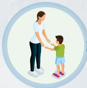
Especialistas en niñez.