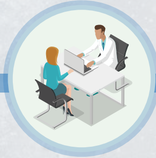
Médico especialista en medicina paliativa.