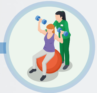
Fisioterapeutas y terapeutas ocupacionales.