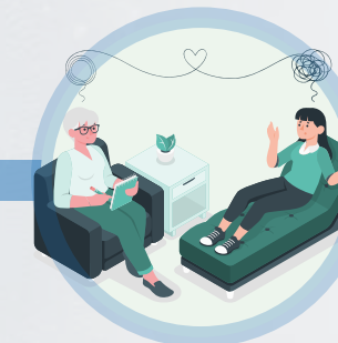
Coordinador especializado en sufrimiento y duelo.