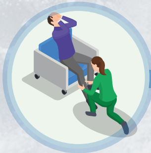
Especialista en dolor.