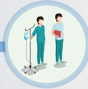
Personal de enfermería.