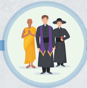
Persona de alguna religión específica.